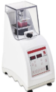
Homogeneizador para disrupción HT Ofrece soluciones simples y eficaces para la molienda rápida de alto rendimiento