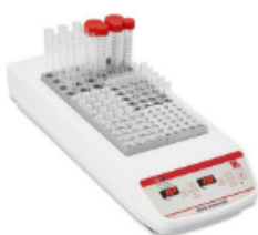
Calentadores de Bloque Seco de 6 bloques Procese más muestras con calentadores de bloque de gran capacidad que brindan resultados precisos y fiables