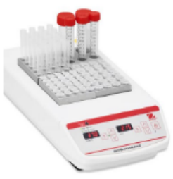
Calentadores de Bloque Seco de 4 bloques Los calentadores de bloque versátiles y confiables brindan resultados precisos y confiables