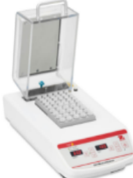
Calentadores de Bloque Seco de 2 bloques Calentadores de bloque versátiles diseñados para uso diario con accesorios para cada aplicación