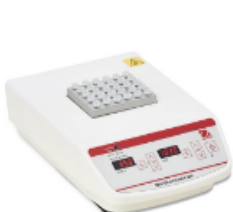
Calentadores de Bloque Seco de 1 bloque Calentadores de bloque versátiles diseñados para uso diario con accesorios para cada aplicación