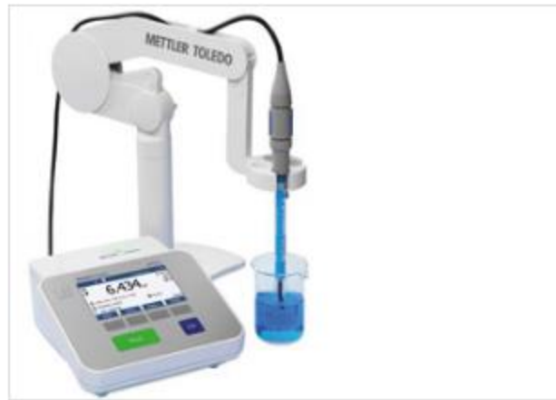
pH-metro/Ionómetro SevenCompact S220